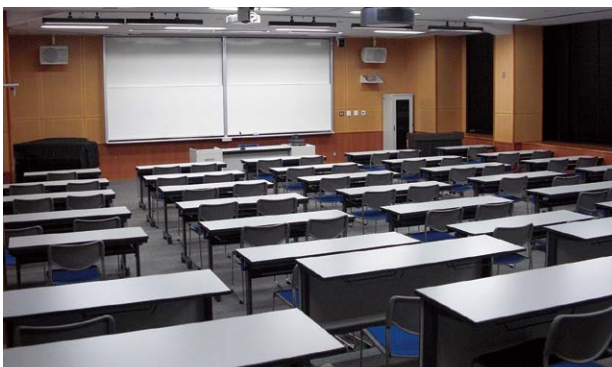
▲総合メディア教室 Comprehensive Media Room

Information technology is taught on the second floor in Comprehensive Media Room, Information Laboratories 1 & 2, and Seminar Room for Information Education.