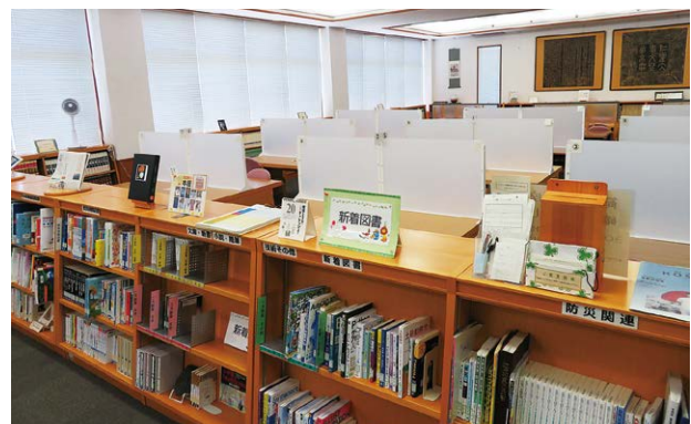
▲閲覧室 Reading Room

Entering the building, you will find the Reading Room on the left and the Media Room on the right. The space adjacent to the Media Room is for newspapers and magazines. The Reading Room has 18 desks for readers, 2 PCs for book search and 10 for Internet browsing and data processing. 30,000 books are available on the open shelves, 49,300 stored on the closed shelves, and 5,900 are loaned to the faculty for extra long periods. Audiovisual materials are also available. The Media Room with 12 tables is for group study making use of the Internet. There is a book return box at the front door.