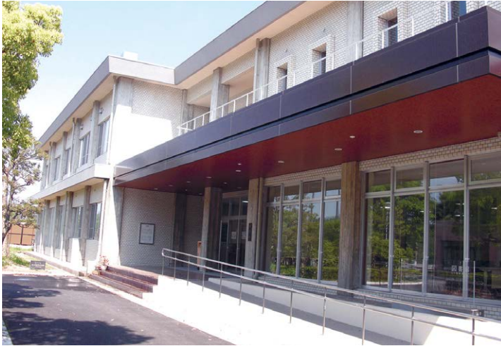
▲図書館 Library Building